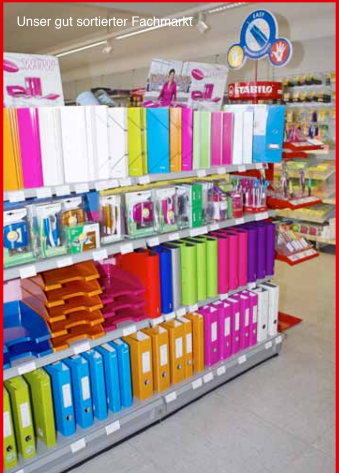
Unser gut sortierter Fachmarkt

Bereits vor vielen Jahren haben wir uns mit 10 weiteren inhabergeführten Unternehmen zur pbs Marketing GmbH zusammengeschlossen, um gemeinsam einzukaufen und unseren Kunden klare Vorteile zu bieten. Als Unterzeichner des pbs-Ehrenkodex tragen wir das deutsche pbs-Logo. Dementsprechend werden unsere Produkte mit Bedacht und Vernunft ausgesucht. Darüber hinaus verpflichten wir uns einer Nachhaltigkeit, die außer der Umwelt, auch wirtschaftliche wie soziale Aspekte berücksichtigt.