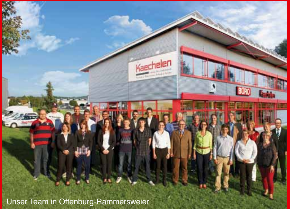
Unser Team in Offenburg-Rammersweier

Überzeugend schnelle Bestellwege garantieren Ihnen einen preiswerten Einkauf. Wählen Sie einfach aus unseren Katalogen Ihre gewünschten Artikel und bestellen Sie bequem per Telefon, Fax oder direkt im Online-Shop. Selbstverständlich freuen wir uns auch über Ihren persönlichen Einkauf in unserem gut sortierten Fachmarkt mit Papeterie und Geschenkartikeln: Bei uns werden Sie sicher fündig.